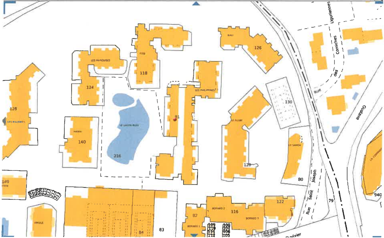
Plans cadastraux de la parcelle BC N° 81 sur la commune de FREJUS (Var) Via le site internet www.geoportail.gouv.fr